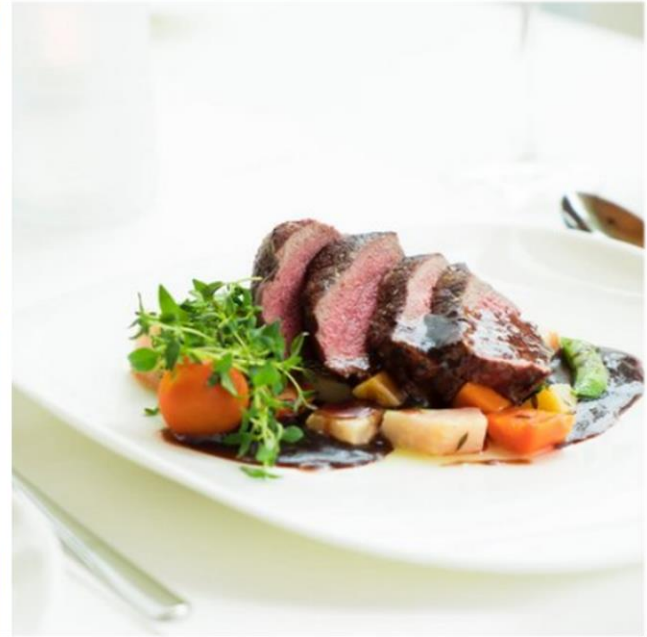
Ausgewogene Ernährung in angenehmer Atmosphäre.