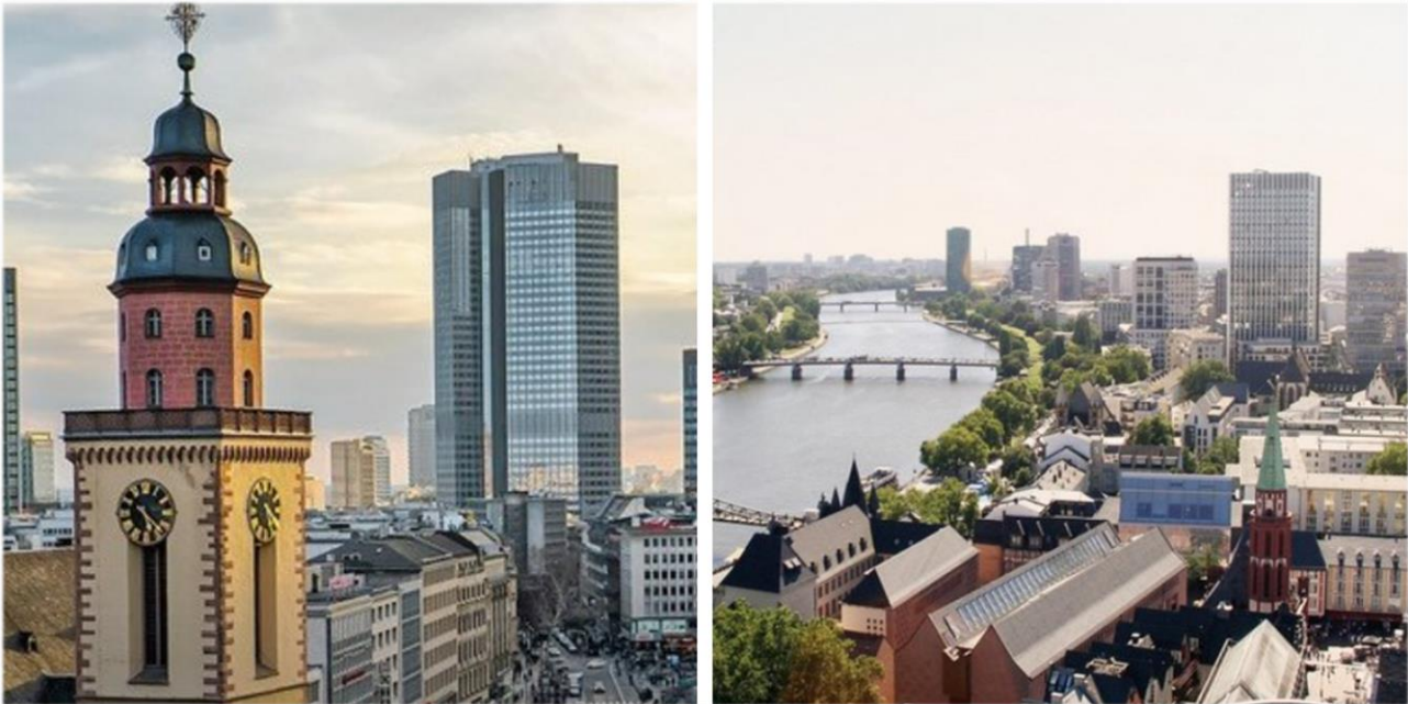
Die Oberberg Tagesklinik Frankfurt am Main im Herzen der Stadt.

Mit dem Auto sind die umliegenden Autobahnen A3, A5, A66 sowie die A661 in wenigen Autominuten zu erreichen.