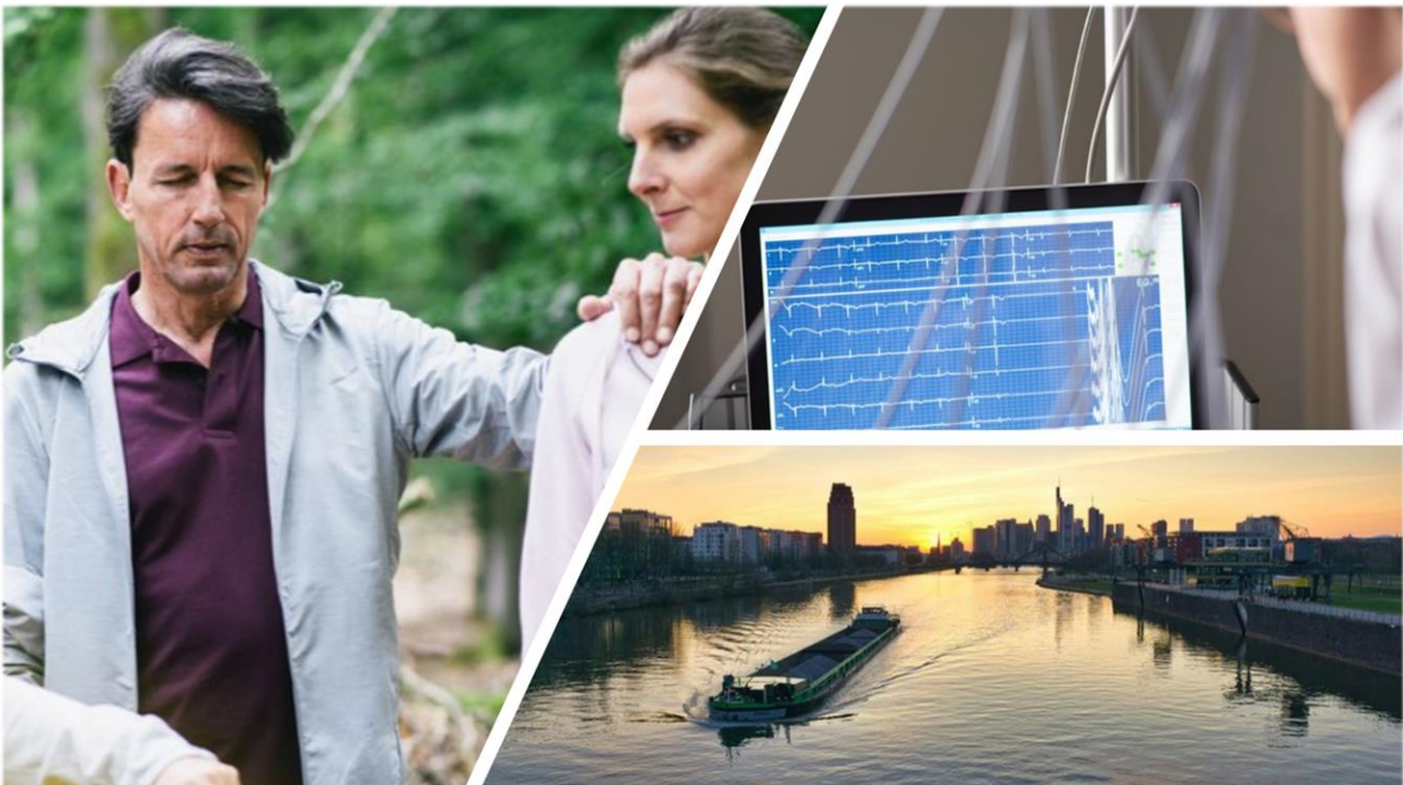
Therapie-Dreiklang für eine ganzheitliche Behandlung: Mensch, Wissenschaft und Atmosphäre.

Die Oberberg Tagesklinik Frankfurt am Main bietet den Patienten im Herzen von Frankfurt Sachsenhausen eine hochqualitative Behandlung der häufigsten psychischen Erkrankungen. Intensiver als jede ambulante Therapie, dennoch nah dran am Alltag - der Anspruch der Oberberg Tagesklinik Frankfurt am Main ist eine hochwertige und individuelle State-of-the-Art-Behandlung, die passgenau auf die persönlichen Bedürfnisse der Patienten zugeschnitten ist. Das allgemeine Behandlungskonzept der Oberberg Kliniken basiert auf einem ganzheitlichen Menschenbild. Bei der Diagnostik werden neben den körperlichen und seelischen Symptomen auch die gesamte Person mit ihrer Biografie, ihrer Persönlichkeit und ihrem sozialen Umfeld betrachtet. Dabei wird stets auf dem neuesten Stand der Wissenschaft gearbeitet und in einer Atmosphäre, in der sich die Patienten wohl und geborgen fühlen. Um bestmögliche Therapieergebnisse zu erreichen und den höchsten Qualitätsansprüchen gerecht zu werden, erfolgt die Behandlung der Patienten nach einem verbindlichen Prinzip: innovativ, intensiv und individuell.